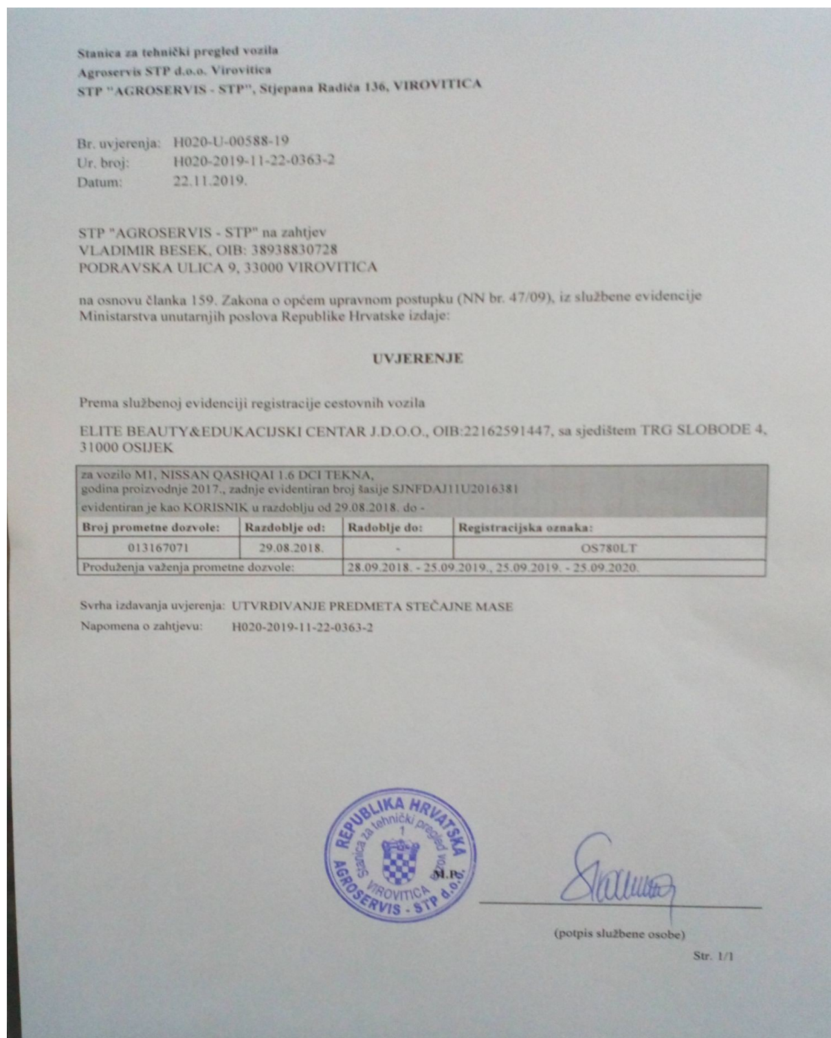
Slika 2. Uvjerenje STPV

Od stanice za tehnički pregled vozila zatraženo je uvjerenje o vlasništvu vozila predmetnog dužnika koje je prikazano na slici 2. Iz uvjerenja je vidljivo kako je predmetni dužnik evidentiran kao vlasnik vozila M1 Nissan Qashqai 1.6 DCI Tekna godine proizvodnje 2017. registracijskih oznaka OS780LT, broja prometne dozvole 013167071 i broja šasijske SJNFDAJ11U2016381.