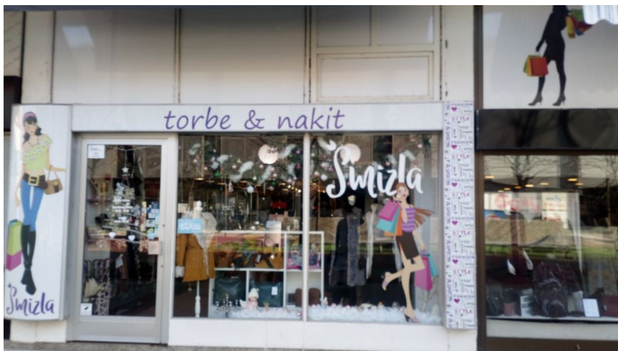
Slika 1. Trg slobode 4, Osijek- sjedište dužnika

Zakonskog zastupnika predmetnog dužnika kontaktiran je telefonski i obaviješten o postupku u tijeku. Adresa sjedišta predmetnog dužnika, Trg slobode 4, Osijek je fizički pohođena i prikazana na slici 1. Na navedenoj adresi se nalazi drugo društvo, te nema nikakvih tragova poslovanja prijašnjeg društva, što je potvrđeno od radnice u fotografiranom društvu.